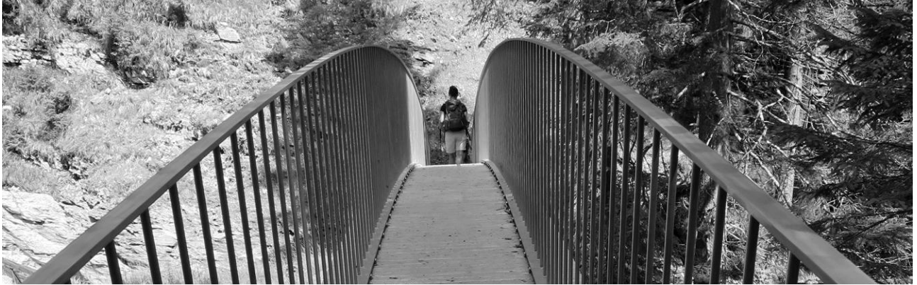
Brücke auf dem Wasserweg von Segnesboden nach Flims, Sommer 2014 (Trutg dil Flem)